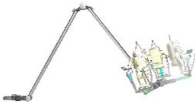
Рис.3. Эксперимент с виртуальной моделью манипулятора ERA: вращение в одном шарнире рысканья фаланги В.

Инструктор тренажно-моделирующего комплекса подготовки космонавта имеет возможность наблюдения за работой космонавта в одном из четырех режимов: