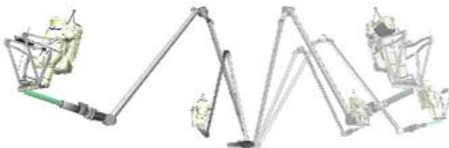
Рис.2. Эксперимент с виртуальной моделью манипулятора ERA: вращение в одном шарнире рысканья фаланги А.

сцен ВКД, иллюстрирующие принцип работы виртуальной модели манипулятора ERA.