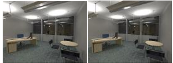
Рис. 3. В сцене 9 источников света и 224921 треугольников. Левая картинка – оптимизированный алгоритм, правая – классический.

Для тестовой сцены на Рис. 3 построение функции распределения вероятности для выбора пар треугольник-источник вместе с расчетом коэффициентов эмиссии для тестовой сцены на Рис. 2 составило 79 секунд, что в 2.77 раза больше времени вычисления прямого освещения аналитическим методом (28.5 секунд). Однако выигрыш на трассировке фотонов составил 3.25 раза. Замедление в вычислении коэффициентов эмиссии вызвано адаптивным делением крупных треугольников в сцене.