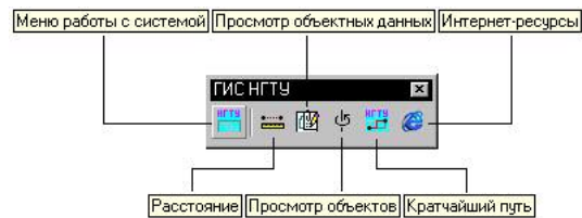
Рис.1. Панель инструментов пользователя прикладной ГИС

VBA проект автоматически загружается вместе с загрузкой Land Development Desktop, активизируется панель инструментов созданная для инженера-пользователя ГИС НГТУ (рис.1).