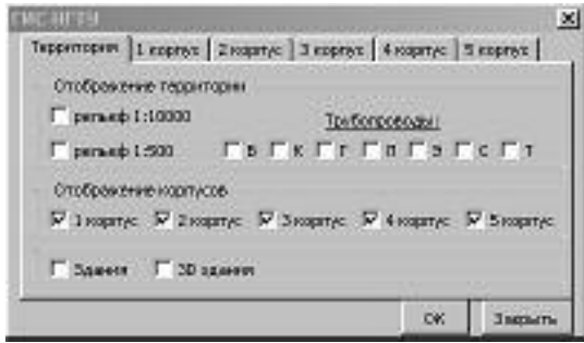
Рис.2. Закладка управления объектами территории